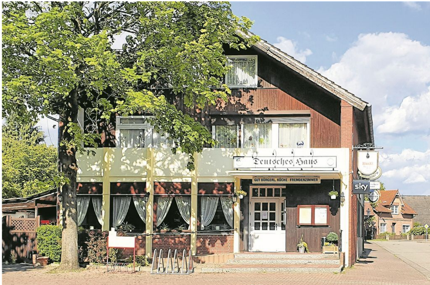
Als ortsbildprägendes Gebäude soll das Deutsche Haus mit rotem Platz erhalten werden. Dafür setzen sich die Mulsumer ein.

In den 1940er und 1950er Jahren gab es einen Kinobetrieb auf dem Saal. Die Firma Wanderlichtspiele Jacci führte jeden Freitag Filme vor. Ende der 1950er Jahre wurde die Höchststadt von ih-