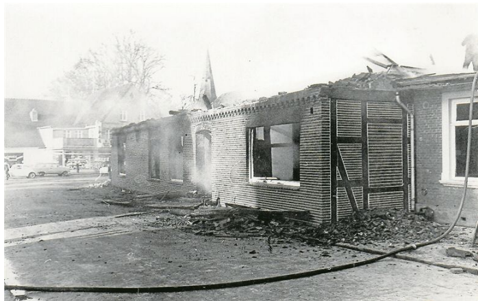
Nachdem 1968 ein Feuer im Mulsumer Ortskern gewütet hat, lag das Deutsche Haus in Schutt und Asche.