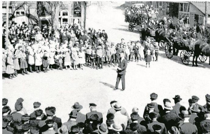
Bei einer Kundgebung auf dem Marktplatz war in den 1920er Jahren das gesamte Dorf versammelt.

rem Kopfsteinpflaster befreit. Aus dem Marktplatz wurde wegen des Ziegelpflasters der Rote Platz. 1961 wurde auch das Deutsche Haus renoviert. Das Fachwerk der Hausfront wurde entfernt und durch eine durchgehende Ziegelsteinfassade ersetzt. Die alte Gaststube wurde ins Clubzimmer hinein vergrößert und aus dem Kolonialwarenladen wurde ein neues Clubzimmer.